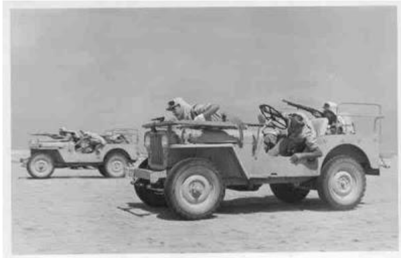
FUEGO A VANGUARDIA CON EL VEHICULO EN MOVIMIENTO

Tras haber desplegado sus tropas en la frontera del Draa , Marruecos rehuyó un enfrentamiento abierto con el Ejército español, que mantenía a la Legión en primera línea de combate. Oficiales marroquíes comenzaron la identificación y captación de antiguos combatientes del Ejército de Liberación, que ya habían intervenido en la guerra de 1957-58, integrándolos en el que sería llamado FLU (Frente de Liberación y Unidad) para recibir, durante seis meses, instrucción terrorista encuadrados en el 7º Batallón Meharista de Tantán. En los primeros meses de este año se calculaba en unos cuarenta los comandos que ya estaban preparados para la acción, encontrándose distribuidos a lo largo de la frontera en las bases militares marroquíes de Tarfaya, Abattih, Meseied y Mosbah.